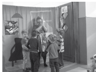
„Cztery mile za piec”.

W ramach realizowanej tematy- „Kasztanowe ludziki”