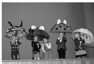
Dzień Babci i Dziadka

stowali się pysznymi ciastami, upieczonymi przez rodziców, za które serdecznie dziękujemy.