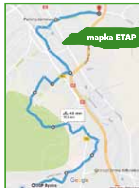
mapka ETAP I

START: Dom Strażaka w Bystrej Bystra: Klimczoka, Fałata, Zdrojowa, Pod Piekiem, Prosta, Cmentarna, Szczyrkowska, Ochota; Bielsko-Biała: Ochota, Modra, Czolgistów, Ustronie, Willowa, Ścieżka rowerowa pod wężem Mikuszowice, Księża Jana Kusia, gen. Stanisława Maczka, Piaskowa, Ścieżka rowerowa od stacji kolejowej Bielsko-Biała Leszczyno po Bulwarach Młodości (Straceńskich) PÓŁMETEK: Parking przy ul. Górskiej