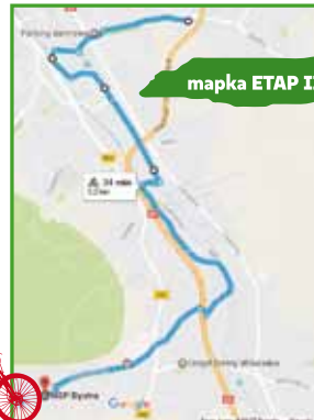
mapka ETAP II

START: Parking przy ul. Górskiej Bielsko-Biała: Ścieżka Rowerowa po Bulwarach Młodości (Straceńskich), Piaskowa, gen. Stanisława Maczka, Kolejowa, Morełowa, Ścieżka rowerowa wzdłuż Białki; Bystra: Zdrojowa, Fałata, Ława, Klimczoka META: Dom Strażaka w Bystrej