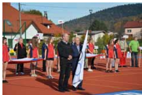
Poczty sztandarowe i olimpijczycy