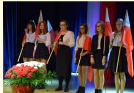
Występ w wykonaniu uczennic z SP2 w Bystrej