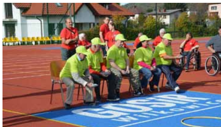
Zawody drużynowe - Słowacy