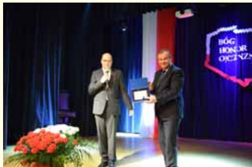
Starosta Gminy Likavka przekazuje podziękowania dla Gminy Wilkowice

W tym roku koncelebrowana msza święta odbyła się w Kościele Parafialnym w Bystrej Śląskiej. Za oprawę muzyczną podczas mszy świętej oraz podczas uroczystości przy Urzędzie Gminy odpowiedzialna była Gminna Młodzieżowa Orkiestra Dęta z Wilkowic.