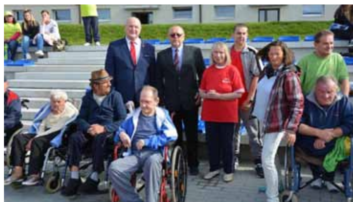
Wicewojewoda wśród zawodników i kibiców