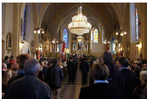
Koncelebrowana Msza św. w Kościele Parafialnym w Wilkowicach.