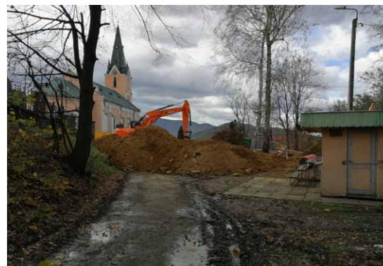
Wilkowice, ul. Cmentarna