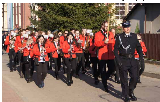
Przemarsz do budynku Ochotniczej Straży Pożarnej w Wilkowicach.