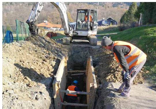
Wilkowice, ul. Długa