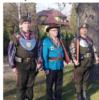
Członkowie Grupy Rekonstrukcyjnej „Muszkiet”. cd. na str. 4