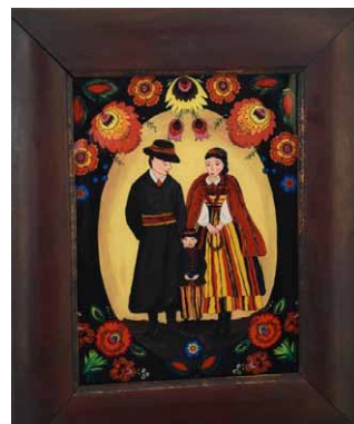
GRAND PRIX ANNA SZNAJDER