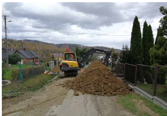
Meszna, ul. Strażacka

Wykonawca tego etapu (firma INSTALBUD Sp. z o.o.) od połowy października do połowy listopada prowadził prace związane z budową kanałów sanitarnych w Mesznej i w Wilkowicach. W pierwszej z tych miejscowości roboty ziemne prowadzone były w ulicach: Pod Skocznią, Olaszyny, Jaśminowa, Strażacka, Rolnicza, Słoneczna, Nadszkolna oraz Po- Ina.