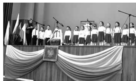
Grupa dzieci z Przedszkola Publicznego Zgromadzenia Córki Bożej Miłości im. Ludwika Binder.

Ze Szkoły Podstawowej nr 1 im. Władysława Jagiełły oraz ze Szkoły Podstawowej nr 2 im. Królowej Jadwigi wzięło udział razem 38 uczniów. Z pośród występujących młodych artystów wyłoniono laureatów w dwóch kategoriach z poszczególnych grup wiekowych. Ze względu na obowiązujące przepisy o RODO