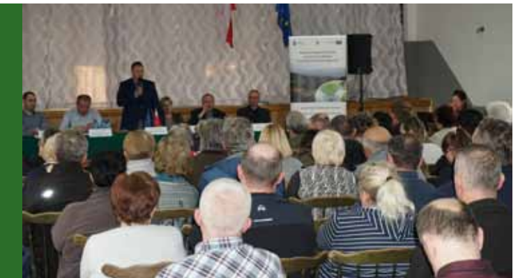
Spotkanie z Mieszkańcami w OSP w Mesznej