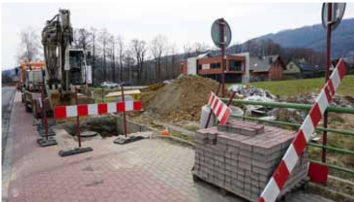
Ul. Szczyrkowska w Mesznej