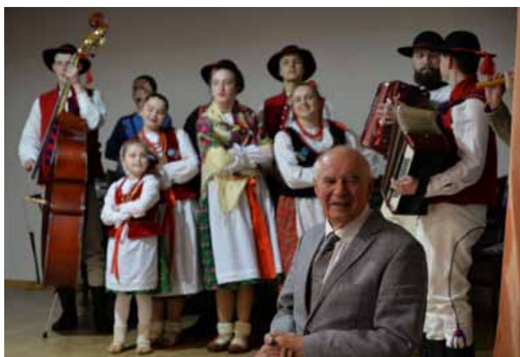
W tle Zespół Pieśni i Tańca „Ziemia Beskidzka”.