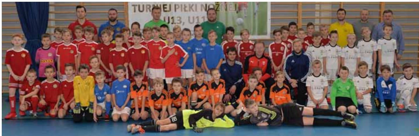
Międzynarodowy Turniej w Piłce Nożnej w Wilkowicach – 19.01.2020 r.

ganizacji wspólnych turniejów piłki nożnej. Dzięki realizacji projektu zawodnicy z Polski i Czech nawiązali współpracę dzięki wspólnej rywalizacji w ramach turniejów. Projekt przewiduje również przeprowadzenie międzynarodowych szkoleń, turniejów oraz dwóch konferencji szkoleniowych. Ponadto, w ramach promocji powstała podstrona internetowa oraz zostanie wydana broszura informacyjna. Miejscem realizacji działań projektowych są obiekty sportowe na terenie Gminy Wilkowice oraz obiekty w mieście Trzyńciec.