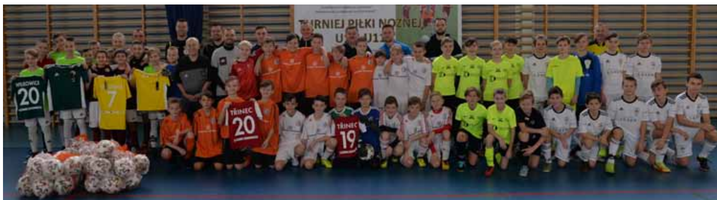
Międzynarodowy Turniej w Piłce Nożnej w Wilkowicach – 18.01.2020 r.

zauważa się powierzchowność wzajemnych kontaktów, jak również brak okazji do bliższego poznania się. Głównym celem projektu jest wzmocnienie współpracy pomiędzy partnerskimi klubami sportowymi, a przez to umocnienie więzi pomiędzy młodzieżą z tych klubów oraz społecznością lokalną. Projekt ma promować zdrowy tryb życia poprzez grę w piłkę nożną, uczyć pracy, rywalizacji oraz gry „fair play”. Dzięki projektowi ma również dojść do wymiany doświadczeń trenerów, kadry szkoleniowej, jak również na poziomie władz klubów. W ramach projektu powstał konspekt na podstawie którego prowadzone są zajęcia treningowe. Ponadto, projekt przewiduje wspólne weekendowe turnieje, które będą połączone ze szkoleniami – pierwszy turniej odbył się w styczniu