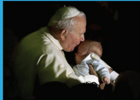
Jan Paweł II całuje dziecko podczas audiencji w Watykanie, 28 listopada 2001 r.

"Ocalić od zapomnienia. Twój Karol Wojtyła - Nasz Jan Paweł II" - konkurs rzeźby i malarstwa na szkło w 100. rocznicę urodzin Świętego Jana Pawła II