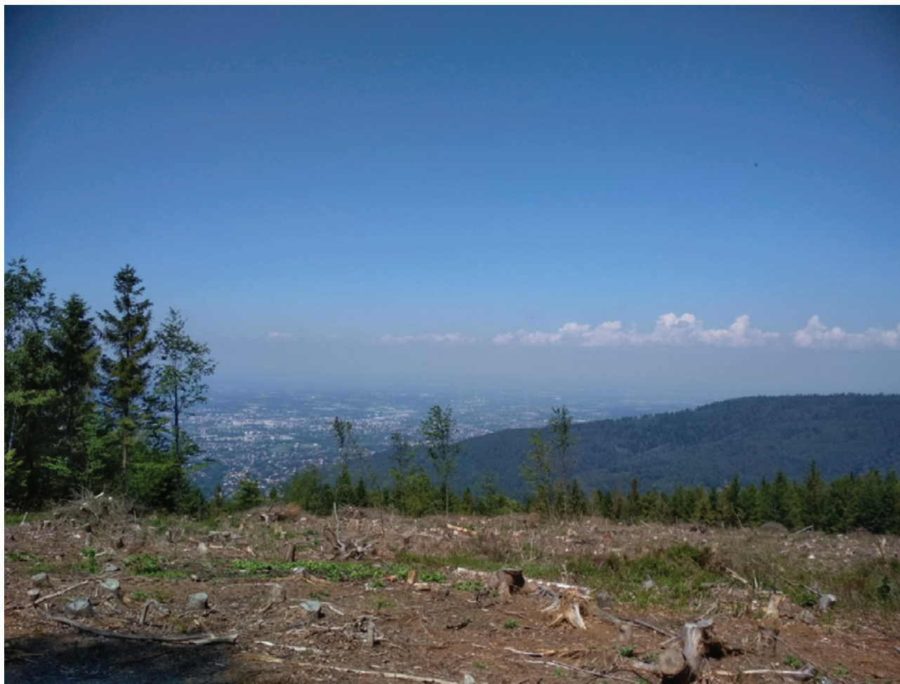
Widok z Magurki