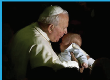
Jan Paweł II całuje dziecko podczas audiencji w Watykanie, 28 listopada 2001 r.

"Ocalić od zapomnienia. Twój Karol Wojtyła - Nasz Jan Paweł II" - konkurs rzeźby i malarstwa na szkło w 100. rocznicę urodzin Świętego Jana Pawła II