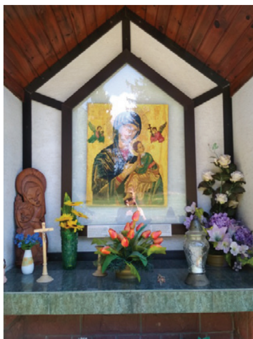
Ikona Matki Bożej Nieustającej Pomocy