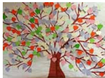
Zespół promujący placówkę

Nie zapomnieliśmy także o naszych milusińskich: przedszkolakach, których obczęstawiliśmy słodkościami. Cały dzień upłynął w atmosferze radości i serdeczności, a dobry humor i życzliwość pozostały z nami na długo.