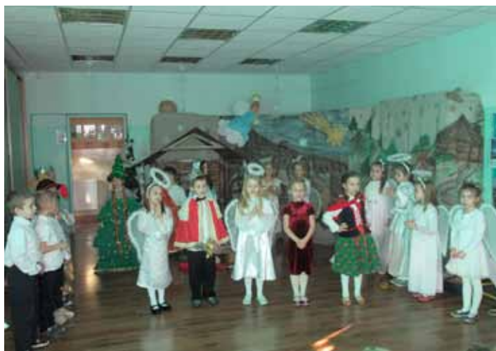
Zespół Promujący Przedszkole

posiłkiem. Dużym przeżyciem, zwłaszcza dla najmłodszych dzieci, było dzielenie się opłatkiem i składanie sobie wzajemnie świątecznych życzeń. Nie zabrakło wspólnego kolędowania, a także rozmów przy wigilijnym stole, dzięki którym wszyscy poczuli świąteczną atmosferę, pełną radości, nadziei i życzliwości. Wierzmy, że wspólne świętowanie przyczyniło się do kultywowania polskich tradycji i było miłym wstępem do przeżywania Świąt Bożego Narodzenia.