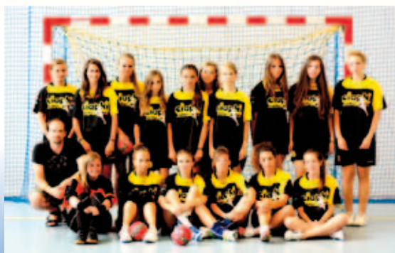
Ciapki z GimBystra - NOWY MISTRZ PODBESKIDZIA