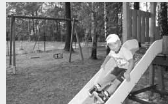
Nowy plac zabaw w Wilkowicach