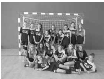
Obecne liderki Podbeskidzkiej Amatorskiej Ligi Podbeskidzia w Piłce Ręcznej dziewcząt

naszej szkoły trenują raz w tygodniu, na sobotnich SKS-ach, natomiast gimnazjalistki, oprócz dziesięciu godzin w klasie sportowej, gdzie połowę czasu poświęcamy na piłkę ręczną, uczestniczą w piątkowych i sobotnich treningach odbywających się na naszej hali sportowej.