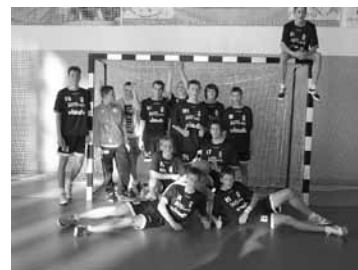
Mistrzynie Gminy w piłce ręcznej

W tym roku do ligowych zmagania przystąpiło 17 drużyn, w tym nasza, pod nazwą GimBystra. Po czterech turniejach zajmujemy w lidze pierwsze miejsce, co jest dla nas ogromnym zaskoczeniem i niesamowitym sukcesem. Starsze dziewczęta, które opuściły mury