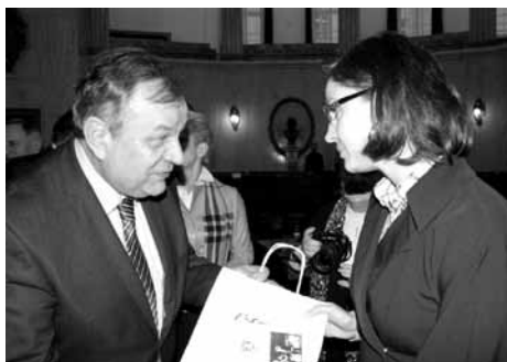
Wójt Gminy w towarzystwie Minister Sportu Joanny Muchy

czynione inwestycje w Gminie Wilkowice dają nam mieszkańcom, naszym pociechom, niepowtarzalną wręcz okazję do rozwijania swoich pasji sportowych – rekreacyjnie, a dla chętnych i utalentowanych profesjonalnie. Jest to, w moim przekonaniu, bezpośrednia odpowiedź władz samorządowych Gminy Wilkowice na realizowany program ministerstwa. Ostatni Puchar Magurki oraz Amatorskie Mistrzostwa Polski w biegach narciarskich i najważniejsze opinie uczestników, bezpośrednich adresatów biegów, utwierdzają mnie w przekonaniu, że kroczymy we właściwym sportowo kierunku.