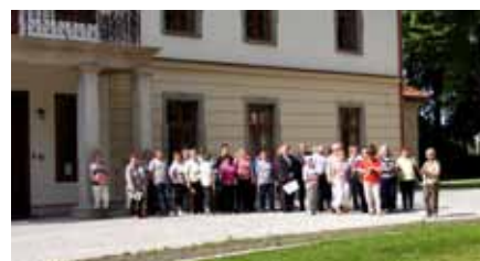
Podczas zwiedzania Pałacu Czeczów w Kozach

W dniu 22 maja 2014 roku partnerzy ze Słowacji wraz z delegacją Kół Gospodyń Wiejskich Gminy Wilkowice uczestniczyli w wycieczce, podczas której zwiedzili Muzeum Browaru Żywiec, podziwiali panoramę okolicy z Góry Żar oraz podziwiali Pałac Czeczów w Kozach, który Gmina Kozy wyremontowała i wyposażyła w ramach polsko-słowackiego projektu.