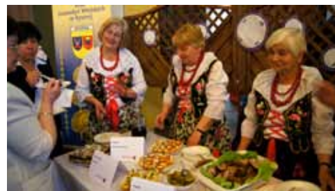
Degustacja potraw na jednym ze stanowisk

no dodatkową atrakcję – pokazy kulinarne kucharza znanego z programów telewizyjnych Remigiusza Rączki (Rączka Gotuje – Śląska Kuchnia). Cieszyły się one olbrzymim zainteresowaniem a przygotowane prążuchy ze skwarkami, czy żeberka jagnięce zostały przez wszystkich docenione.