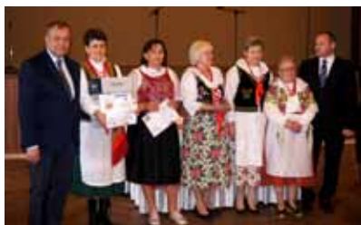
Wręczenie nagród przedstawicielkom wszystkich KGW

przygotowanych potraw degustować można było m.in. kapuśniak ze świeżej kapusty, paszтет drobiowy (Bystra), zupę z zielonej soczewicy, kukułcze jaja według przepisu Cioci Stasi (Meszna), żeberka „Juhasa” z kapustą i ziemniakami, babeczki koktajlowe (Wilkowice), mięso wieprzowe z grilla, kluski z makiem (Bziny) oraz bigos świętokrzyski, paszteciki (Morawica). Konkursowe jury dokonało oceny potraw przyznając miejsca od pierwszego do trzeciego oraz wyróżnienia w pięciu kategoriach. Program imprezy uatrakcyjnił występ dzieci z Zespołu Szkolno-Przedszkolnego w Mesznej oraz akordeonisty z Gminy Morawica.