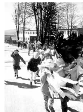
Nauczycielki z Przedszkola Publicznego w Wilkowicach

Kształtowanie postaw ekologicznych jest procesem długotrwałym i złożonym, dlatego powinniśmy zacząć już od najmłodszych lat. Dziecko jest wtedy najbardziej chłonne i podatne na wpływ otoczenia i nauczyciela. Zdobyta przez dziecko wiedza, nabyte umiejętności, postawa społeczno - moralna, są pogłębiane, wzmacniane na dalszych szczeblach kształcenia. Wychowanie i kształcenie dzieci w duchu umiłowania, szacunku i rozumienia świata przyrody jest jedną najważniejszych sfer rozwoju dziecka w przedszkolu.